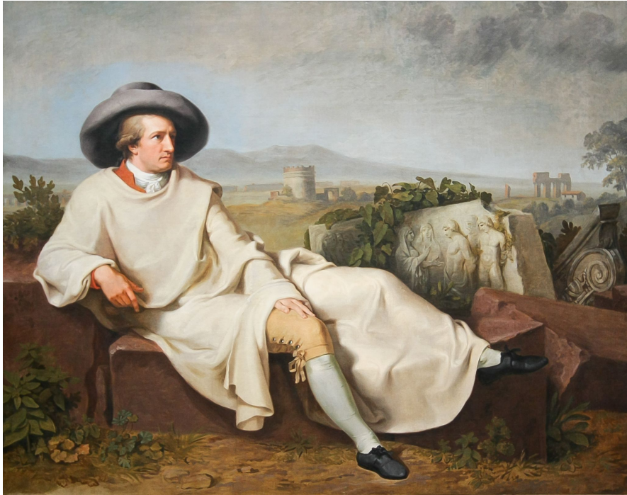
Johann Heinrich Wilhelm Tischbein, Public domain, via Wikimedia Commons